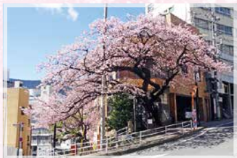
坂町の寺桜(熱海市)

静岡茶の祖・聖一國師(しょういちこくし)の生誕地、米澤家の敷地内にある樹齢300年の一本枝垂桜です。MAP18