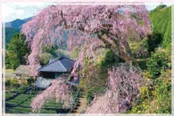
栃沢のしだれ桜(静岡市オクシズ)

静岡茶の祖・聖一國師(しょういちこくし)の生誕地、米澤家の敷地内にある樹齢300年の一本枝垂桜です。MAP18